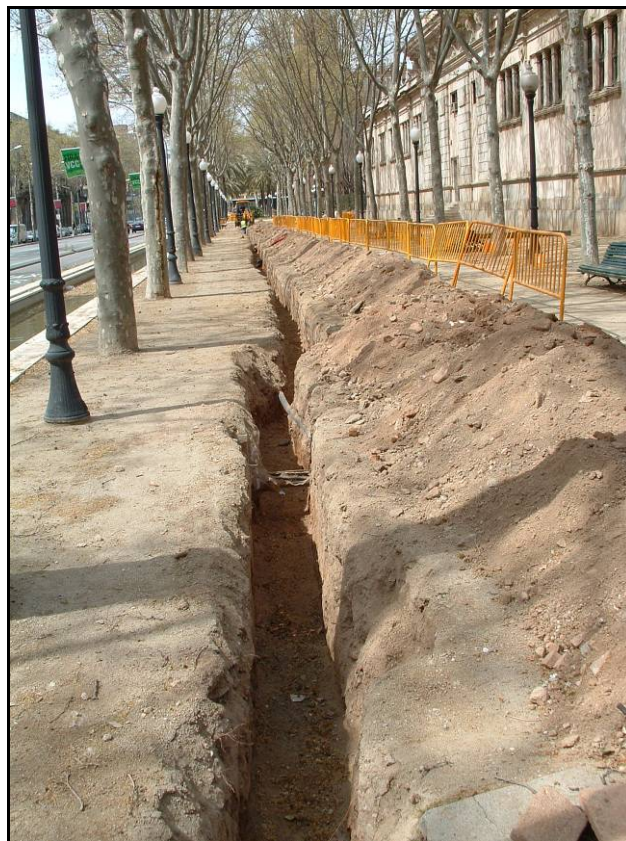
Fotografia 6. Detall rasa un cop realitzat el buidatge.