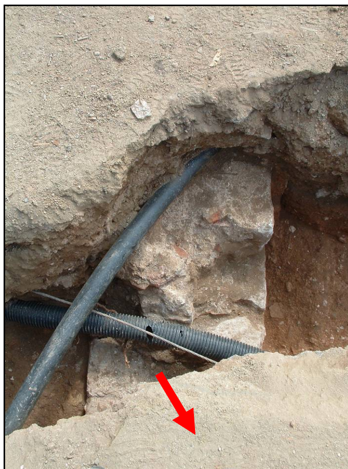
Fotografia 9. Detall U.E.108.