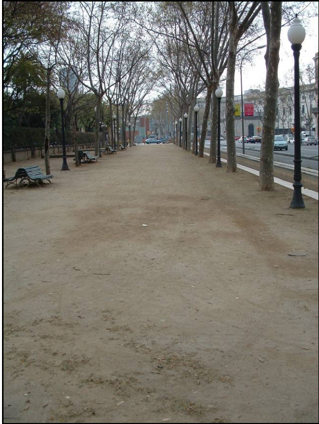
Fotografia 2. Detall del Passeig Picasso abans de començar els treballs.