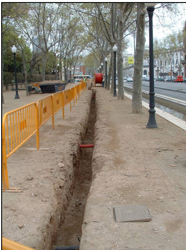
Fotografia 7. Detall rasa un cop realitzat el buidatge.