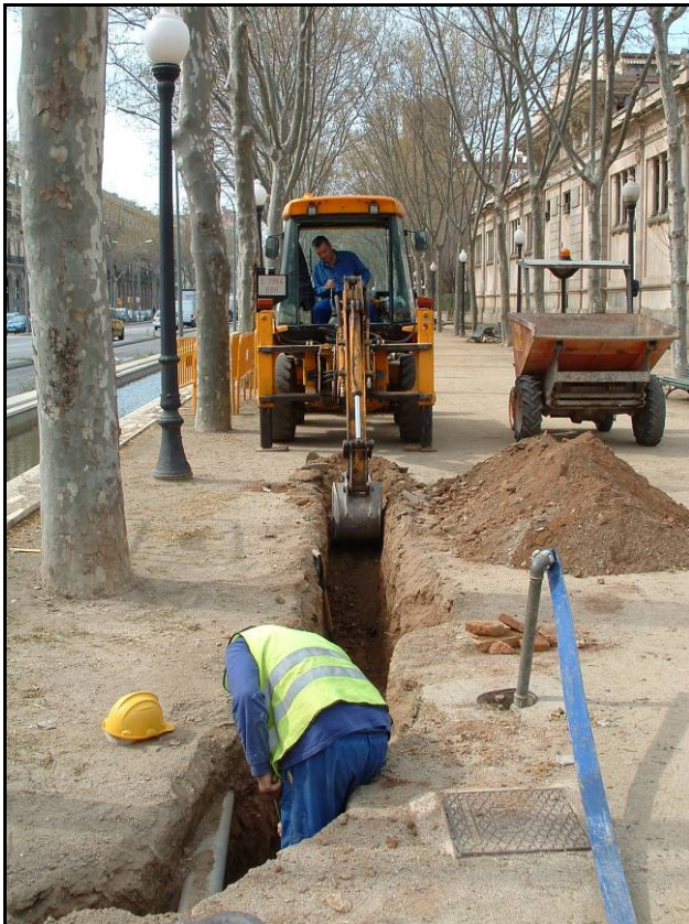
Fotografia 3. Detall treballs de buidatge de la rasa.