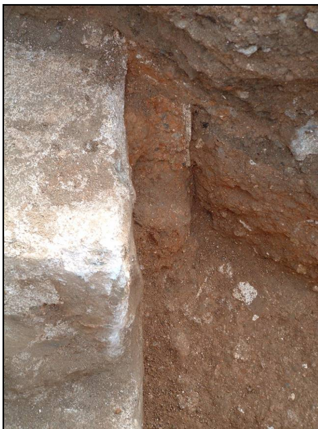
Fotografia 10. Detall preparació arrebossat U.E.110.