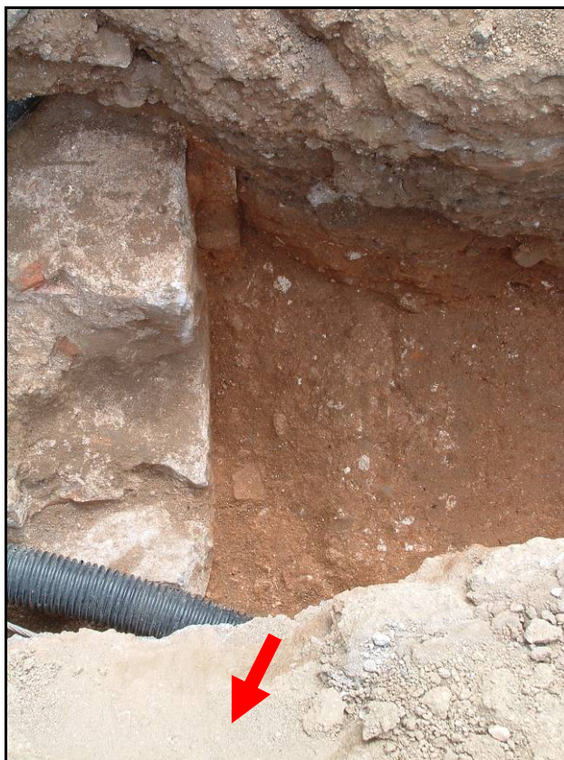
Fotografia 11. Detall preparació paviment U.E.112.