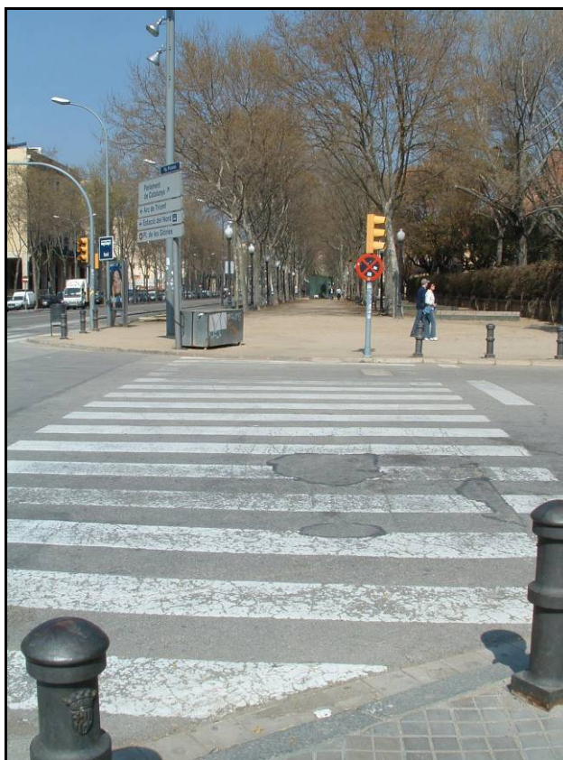
Fotografia 1. Detall del Passeig Picasso abans de començar els treballs.