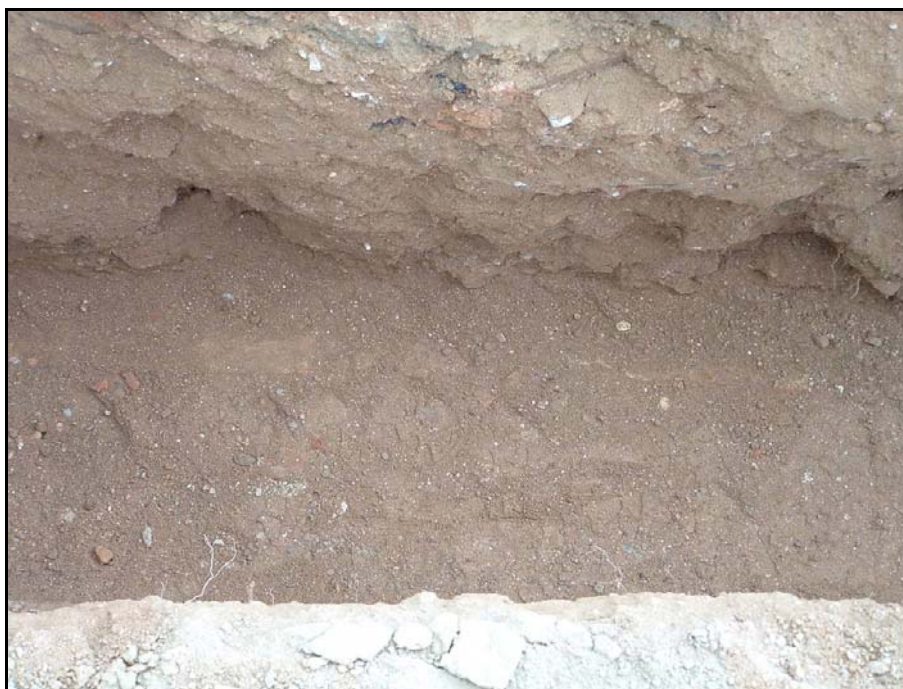
Fotografia 8. Detall perfil estratigràfic de la rasa realitzada. S'aprecia el paquet U.E.101.