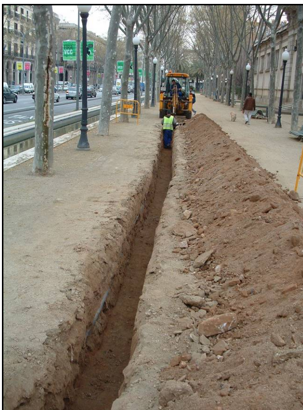
Fotografia 4. Detall treballs de buidatge de la rasa.