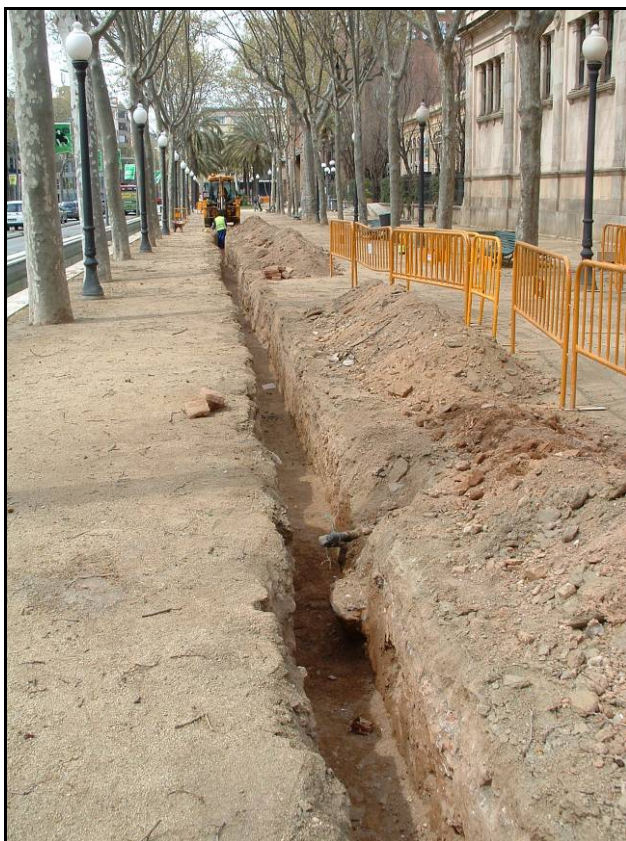
Fotografia 5. Detall rasa un cop realitzat el buidatge.